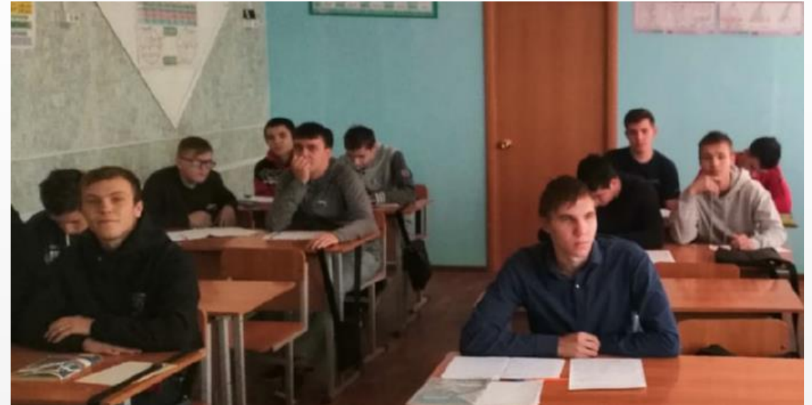
классный час «Безопасность в сети интернет»