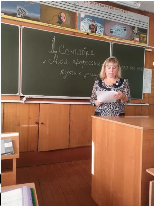
классный час «День знаний