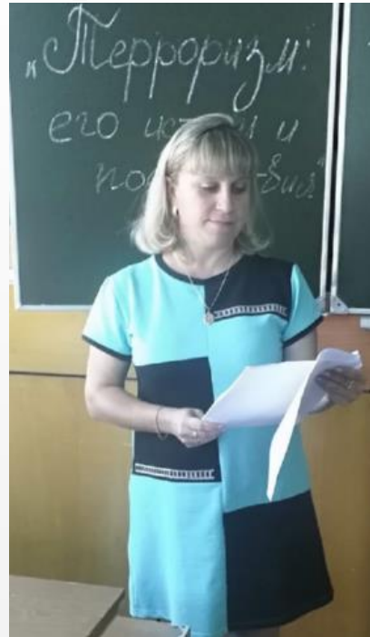
классный час «Терроризм: его истоки и последствия»