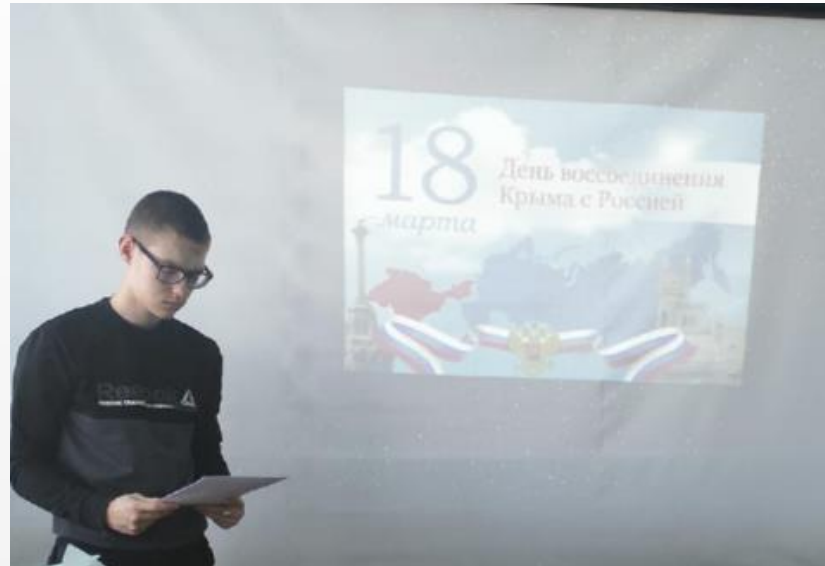
классный час «Воссоединение Крыма с Россией»