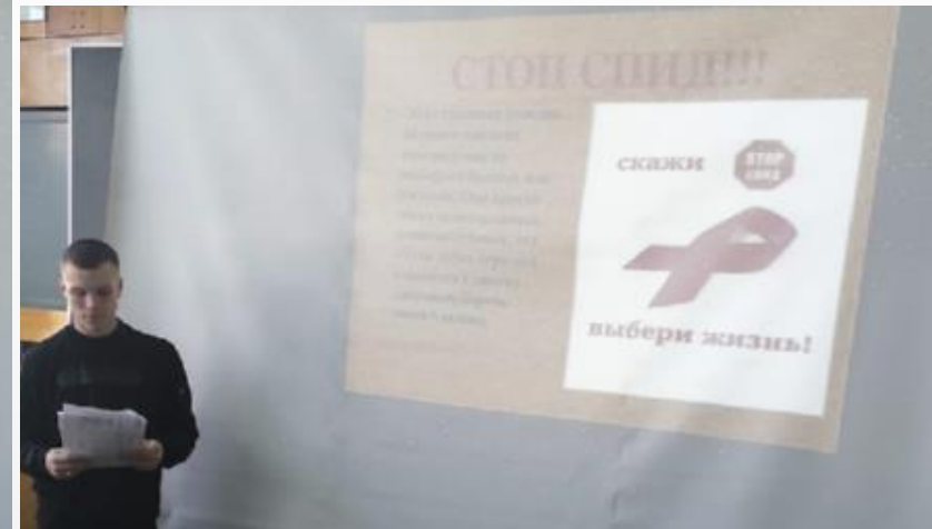
классный час «СТОП ВИЧ/СПИД»