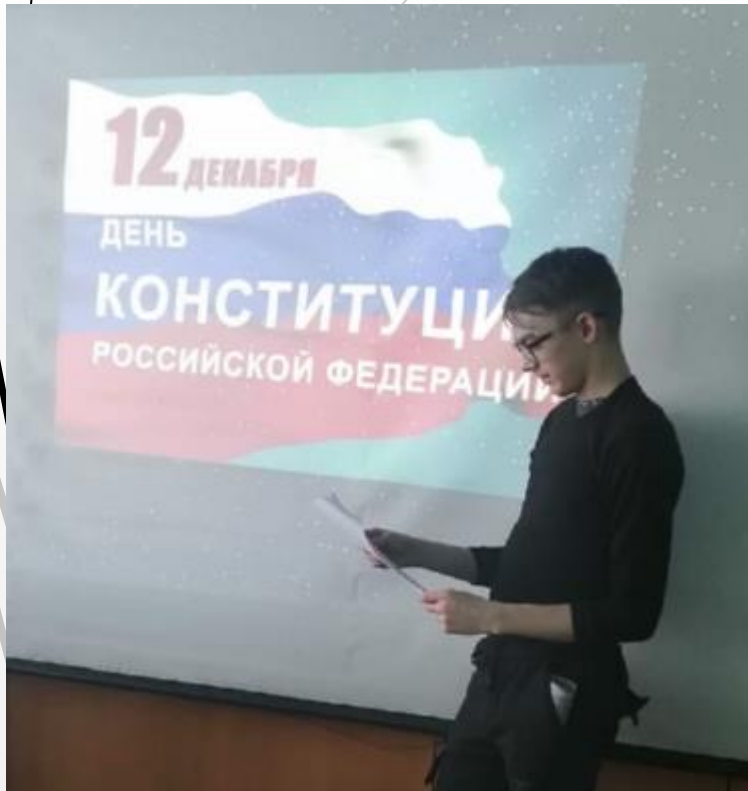
классный час ко Дню Конституции «Знатоки права»

Критерий IV. Личный вклад в повышение качества образования, совершенствование методов обучения и воспитания, и продуктивное использование новых образовательных технологий, транслирование в педагогических коллективах опыта практических результатов своей профессиональной деятельности, в том числе экспериментальной и инновационной