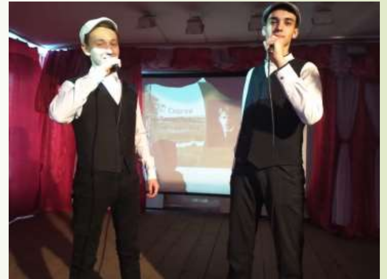
открытое мероприятие «125 лет русскому поэту Сергею Есенину»