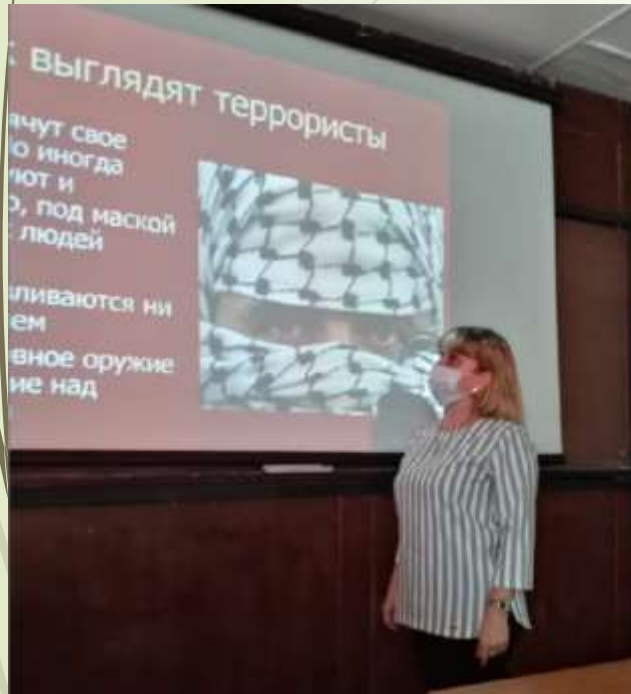
классный час «Терроризм – угроза обществу»