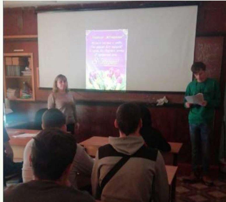
классный час «Мама – ближе человека нет»